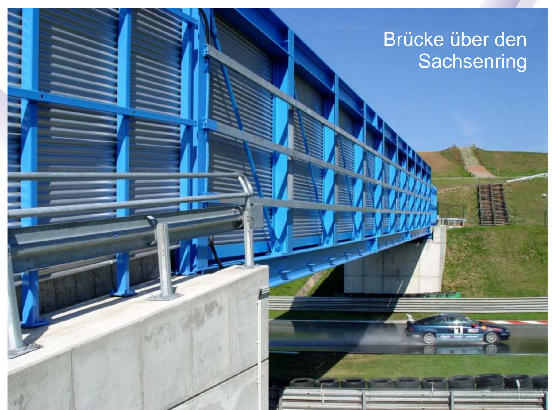
Brücke über den Sachsenring

Lassen Sie uns in einem intensiven Gespräch detailliert über die Anforderungen Ihres Bauprojektes sprechen.