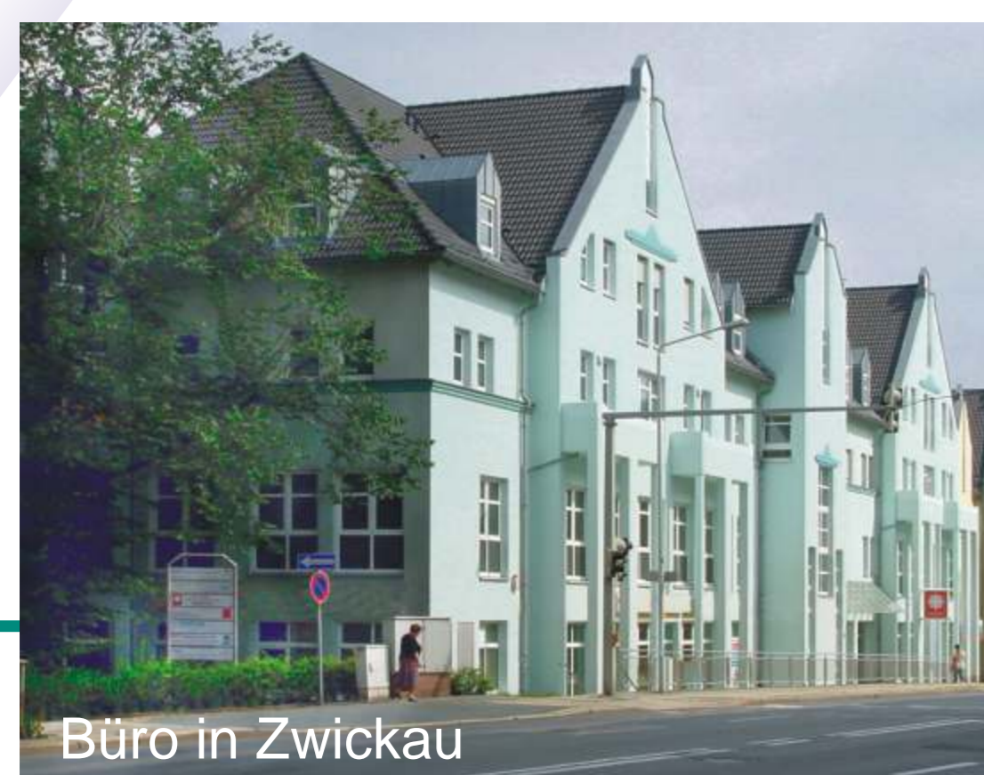
Büro in Zwickau

das ganze vor augen - das detail im griff